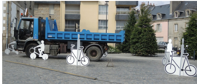
Sensibilisation aux angles morts des poids-lourds