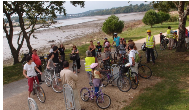
Balade découverte du patrimoine sur les bords de l'Odet (Quimper)