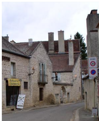
Cette de Lyon

À l'intérieur de la zone 30, si les caractéristiques et l'environnement des voies incitent naturellement à des vitesses inférieures à 30 km/h, l'aménagement peut déjà être considéré comme cohérent : il n'y a donc pas nécessité dans ce cas de mettre en place des dispositifs complémentaires. À l'inverse, si certaines voies encouragent la pratique de vitesse supérieure à 30 km/h, l'aménagement devra concourir à modérer cet effet. Variation de profil en long et en travers, réduction de la largeur de la chaussée, traitement des carrefours en plateau, rétablissement de la priorité à droite : les techniques sont connues. Il s'agira surtout d'articuler ces interventions autour d'une stratégie globale d'aménagement visant à exprimer le caractère urbain et la convivialité des lieux, ce qui revient souvent à privilégier le confort du piéton et des cyclistes.