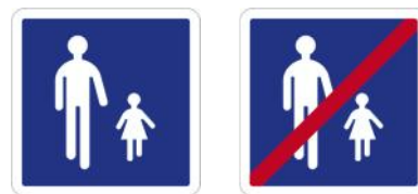
La signification réglementaire des panneaux d'entrée et de sortie d'aire piétonne a changé.

La nouvelle signification des panneaux d'entrée et de sortie d'aire piétonne rend donc superflus la mise en place d'une signalisation spécifique - panneaux ou panonceaux - pour indiquer ces prescriptions.