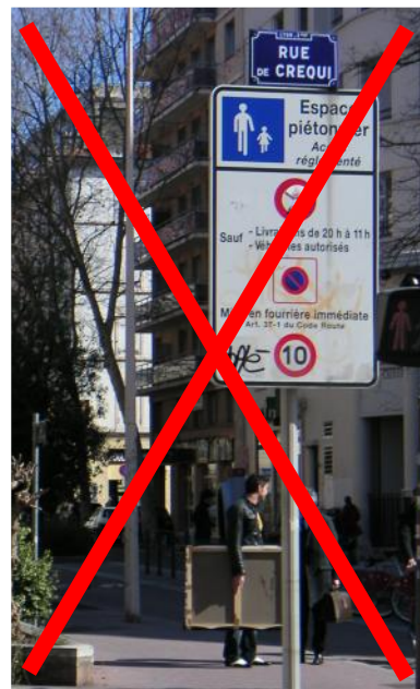
Il n'est plus nécessaire de compléter la signalisation d'entrée d'aire piétonne par des panneaux de limitation de vitesse, d'interdiction de stationnement ou d'interdiction de circuler pour les véhicules.