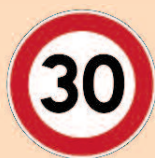
Panneau de type B14

Le panneau de limitation de vitesse de type B14 ne s'applique que sur l'axe sur lequel il est implanté jusqu'à un panneau modifiant cette prescription.